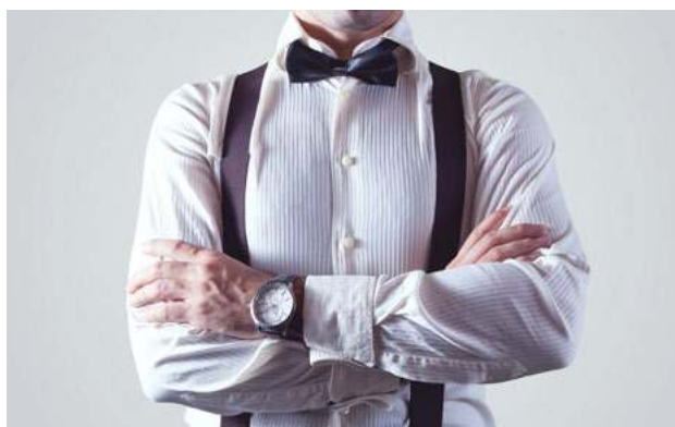
Muž je hlavou rodiny...