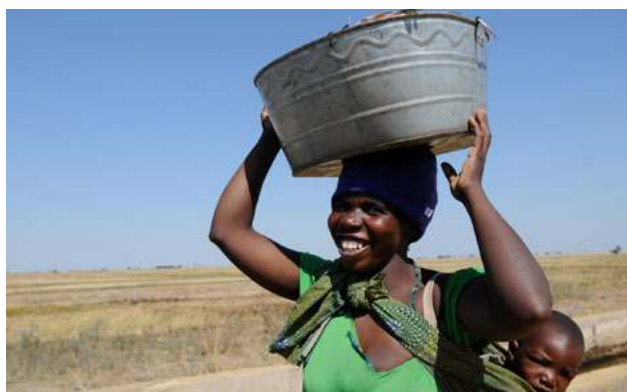
Dělám na poli, nosím vodu, starám se o děti...