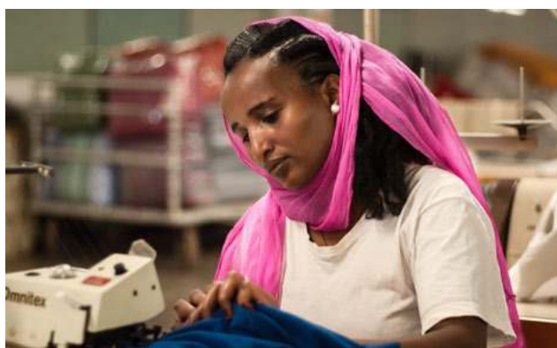
Ženy dostávají za tutéž práci zapláceno méně než muži.