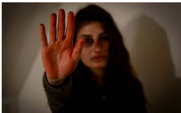
Až 70 % žen ve svém životě zažije fyzické či sexuální násilí od mužů.

Následující přílohy (č. 1-5) naleznete zde .