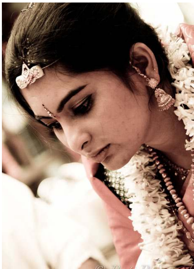
Je mi 12 a už se vdávám.