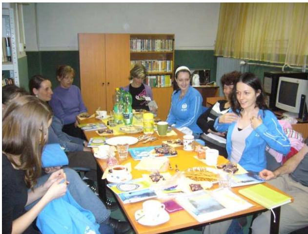
FOTO: SUPERVIZE DOBROVOLNÍKŮ V DD DOBRÁ VODA.